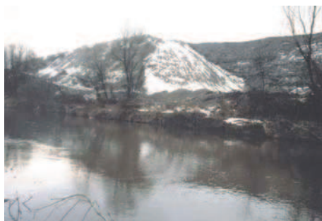
Ryc. 3–4. Widok na składowiska odpadów odlewniczych w Ozimku, potocznie zwane „nową hałdą” w 2004 r.