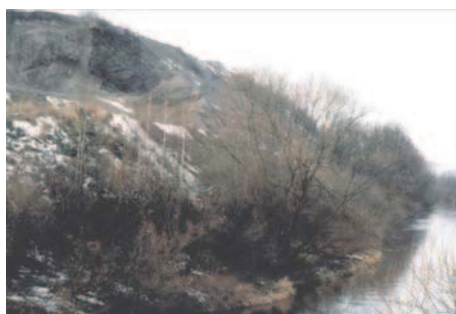
Ryc. 1–2. Widok na składowiska odpadów odlewniczych w Ozimku, potocznie zwane „starą hałdą” w 2004 r.