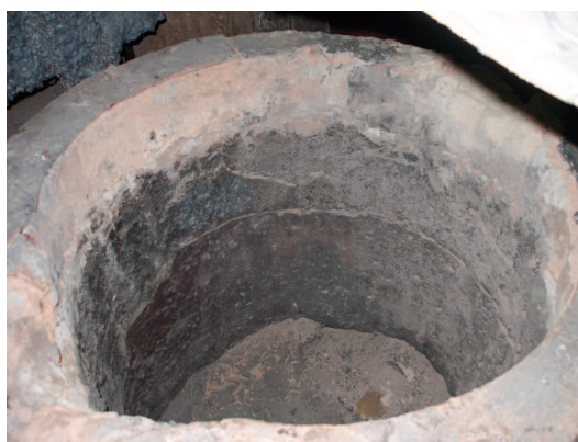
Ryc. 2. Kadź żeliwiakowa wymurowana nowymi wyrobami wysokoglinowymi modyfikowanymi SiC w trakcie eksploatacji (A) i po wystudzeniu (B)